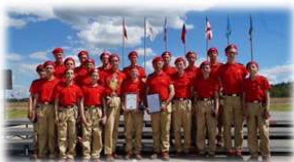
Призеры Всероссийского юнармейского лагеря «Гвардеец – 1»

«Русские витязи». Кадеты, воспитанники данных военно-патриотических объединений, неоднократно становились победителями и призерами Всероссийских, региональных и муниципальных соревнований (Всероссийский историко-краеведческий слет «Мы – патриоты России», «Нижегородская школа безопасности – Зарница», Всероссийский фестиваль творчества кадет «Юные таланты России», Всероссийский юнармейский оборонно-спортивный лагерь Приволжского Федерального округа «Гвардеец-1», Второй Всероссийский конкурс профессионального мастерства «Делай, как я!» среди воспитанников ВПК, районный смотр-конкурс «Виктория» среди воспитанниц ВПК).