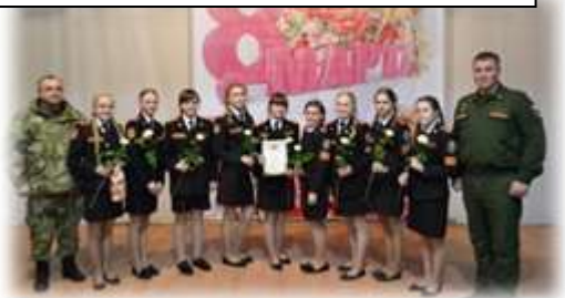
Победители районного смотра-конкурса «Виктория»