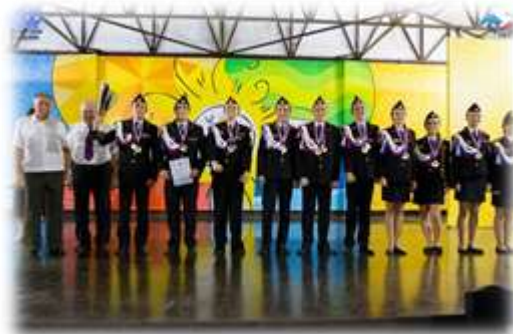
Победители Всероссийского фестиваля творчества кадет «Юные таланты Отчизны»