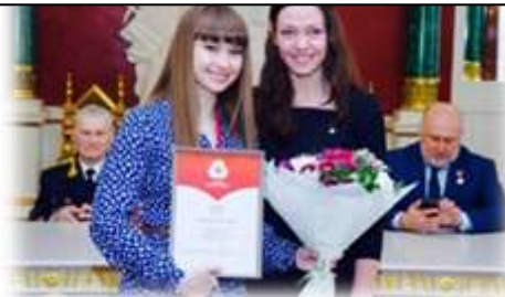
Победитель Всероссийского конкурса профессионального мастерства «Делай, как я!»

Воспитанники военно-патриотических объединений школы непрерывно, систематично совершенствуют свой уровень знаний и навыки в военно-прикладных видах в течение всего учебного года в урочное и во внеурочное время. Кроме того, воспитанники военно-патриотических объединения являются наставниками младших школьников, которые входят в состав детского общественного объединения «Юный гражданин России». Старшие кадеты проводят занятия по строевой и огневой подготовке, а также другим военно-прикладным видам, что особо важно для обучающихся, перешедших в 5 класс, которые будут вступать в ряды кадет (Юнармии).